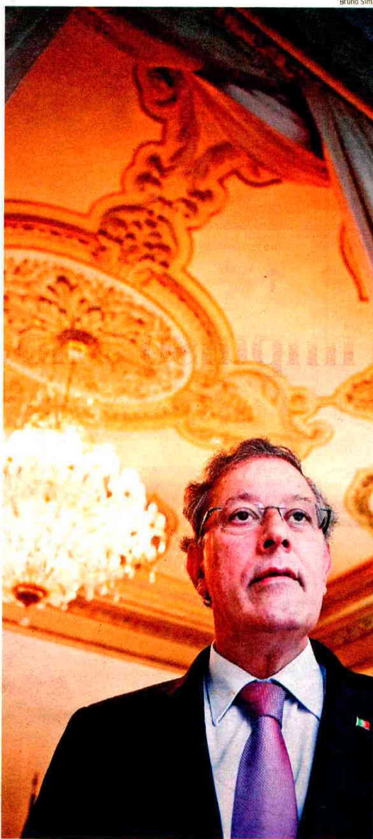
Almeida Henriques | Secretário de Estado Adjunto da Economia quer que construtoras aproveitem oportunidades em África e na América Latina.

Almeida Henriques destacou também o desenvolvimento de uma diplomacia económica em mercados externos com potencial, essencialmente em África e América Latina, assinalando que a internacionalização das empresas do sector contribui não só para a sua estabilidade como tem ainda uma componente de exportação de bens e serviços. O sector representava, em 2011, 10% das exportações nacionais.